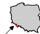
Rysunek 1 Obszar dorzecza Łaby z podziałem na regiony wodne na tle podziału administracyjnego kraju