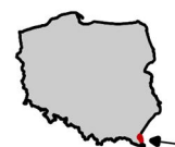
Rysunek 1 Obszar dorzecza Dniestru z podziałem na regiony wodne na tle podziału administracyjnego kraju