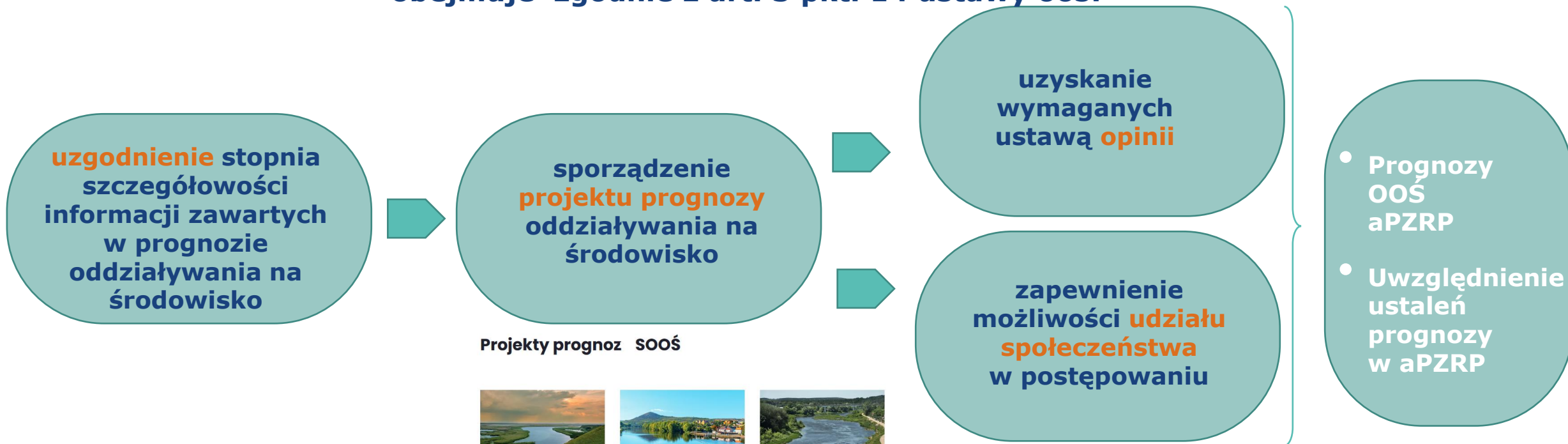
Projekty prognoz SOOŚ

obejmuje zgodnie z art. 3 pkt. 14 ustawy ooś: